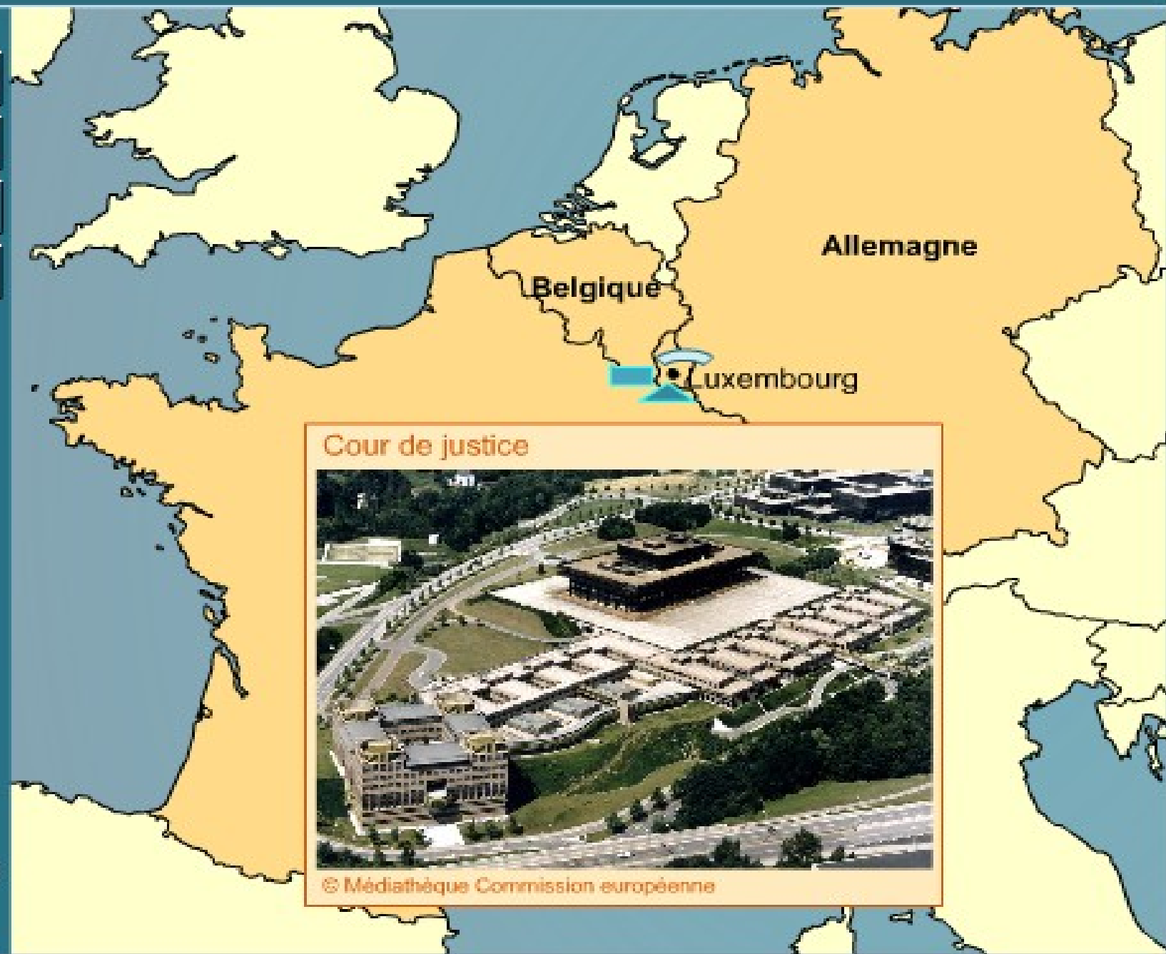
Cour de justice