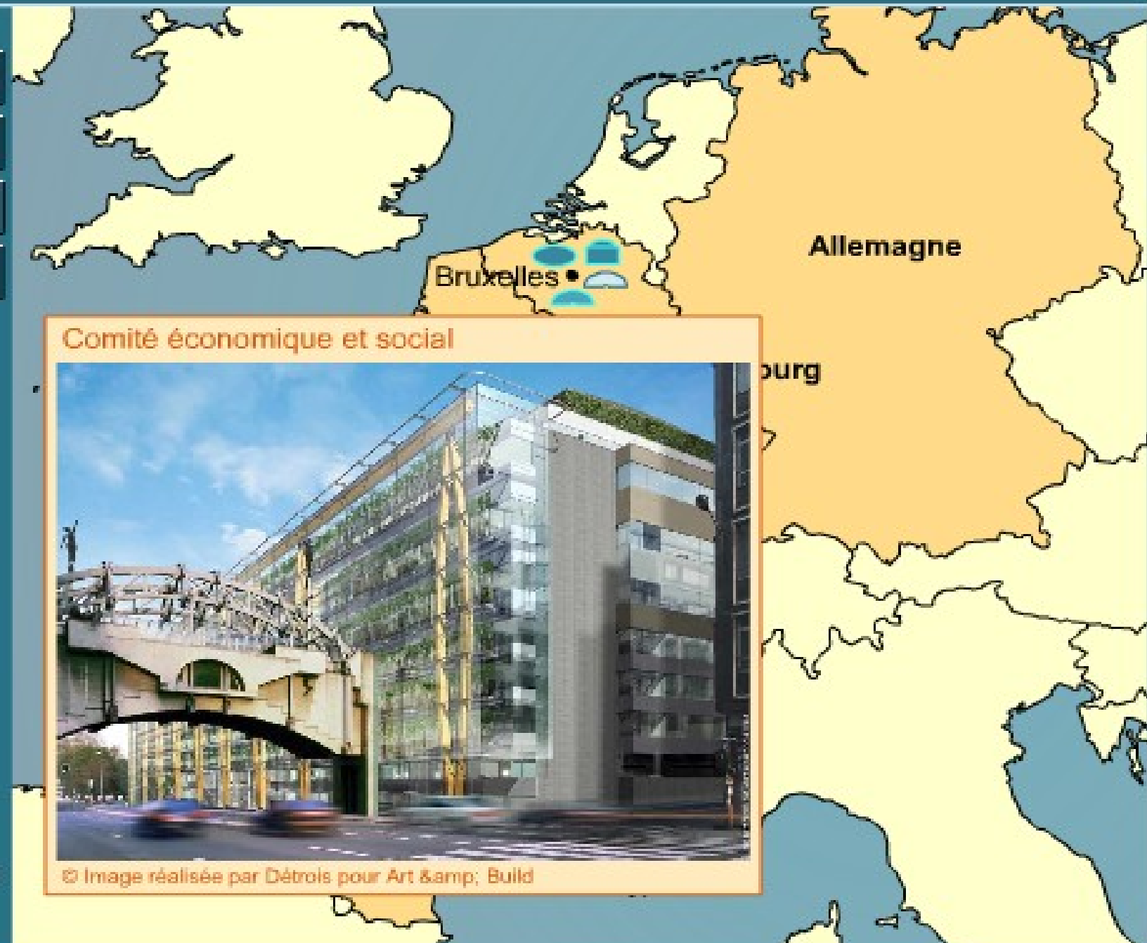
Comité économique et social